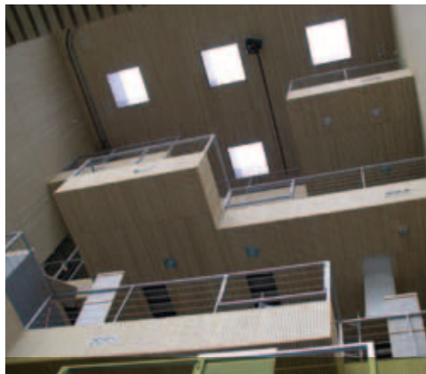
MOSO Bambus - Paneele und -Furniere Rijkswaterstaat Middelburg (Paul de Ruiter)