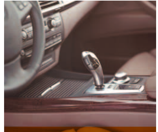
MOSO grenzenlose Möglichkeiten Furniere - BMW X5 dashboard