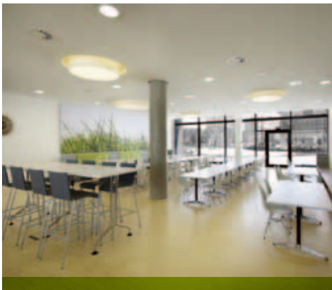
MOSO Bambus Bodenbelag HSE Darmstadt (Rubly Architekten)