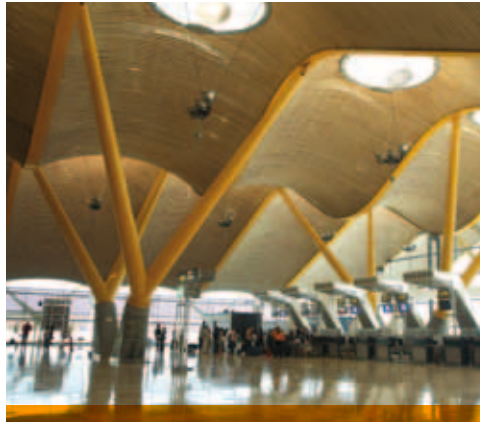
MOSO grenzenlose Möglichkeiten Furniere - Barajas Flughafen (Richard Rogers)