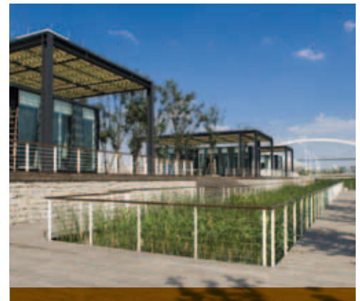
MOSO Bambus Außendielen World Expo Shanghai